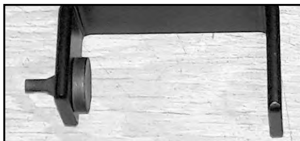
Abb.1 / Pic.1

Stick the rubber plug through the hole on the left side from the inside. Remove the original screw from the frame (see pic 3), it will be reused.