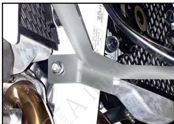
Abb.3 / Pic.3