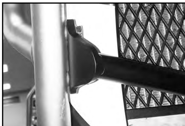
Abb.2 / Pic.2

In the direction of travel on the right with the original screw in the now free thread.